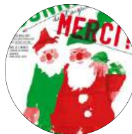
Père Noël Verts Novembre à décembre