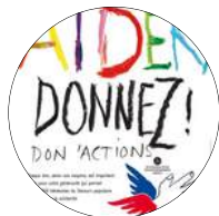
Don'Action Janvier à mars