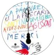
Pauvreté précarité Septembre à novembre