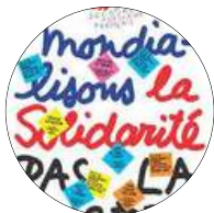
Printemps de la solidarité mondiale Mars à mai