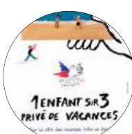
Accès aux vacances Mai à août